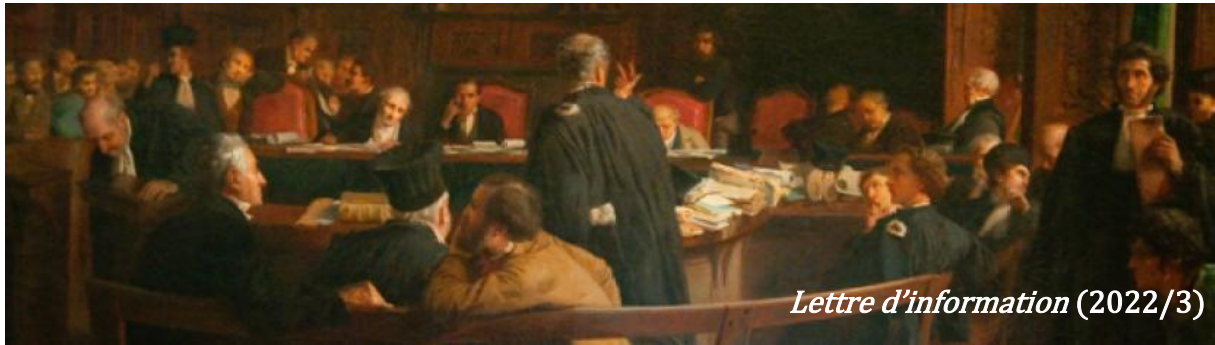
Lettre d'information (2022/3)