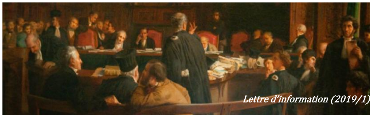
Lettre d'information (2019/1)